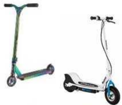
Самокат/ электрический самокат