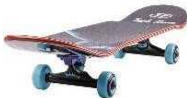
Скейтборд/ электрический скейтборд