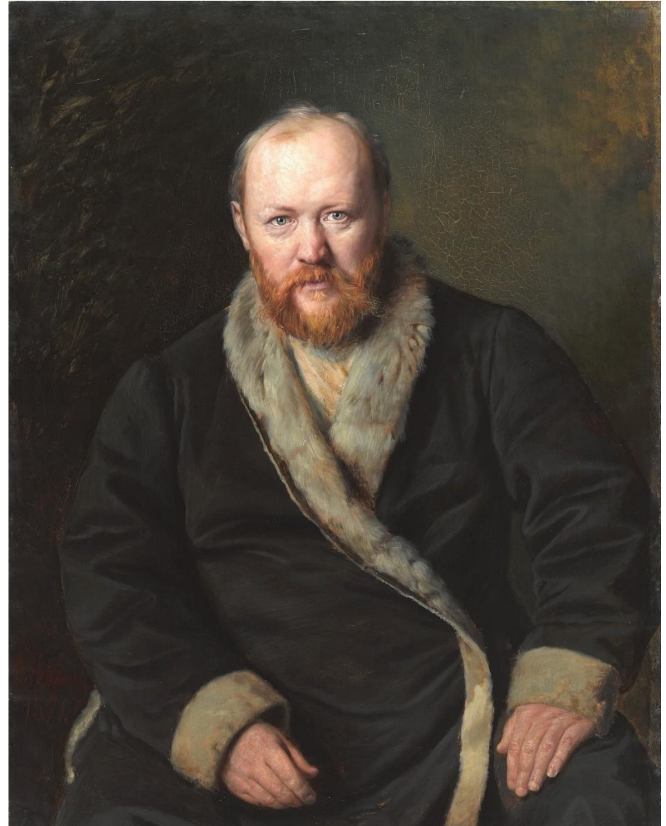
А. Н. Островский (1823-1886)