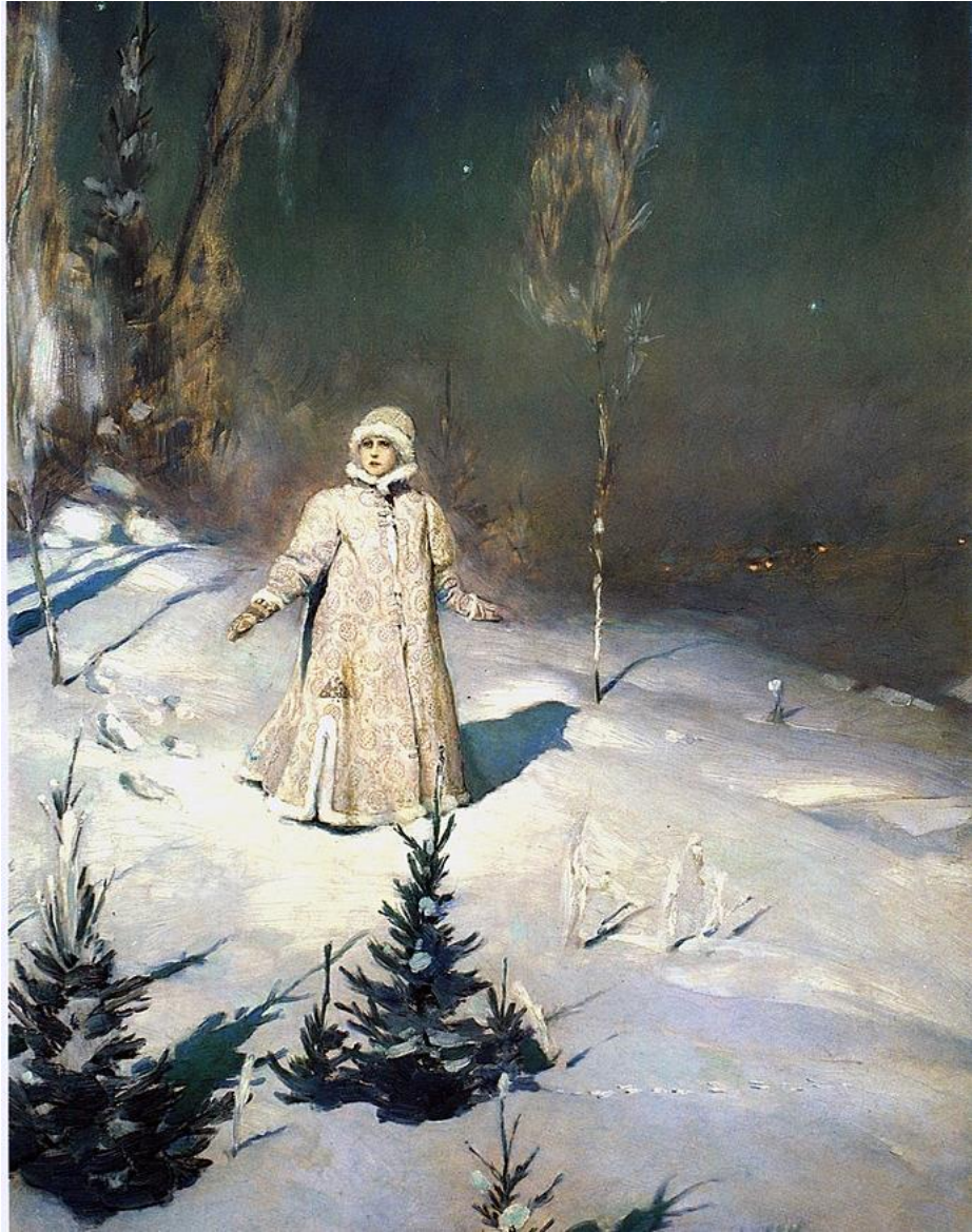
«Снегурочка», В.М. Васнецов