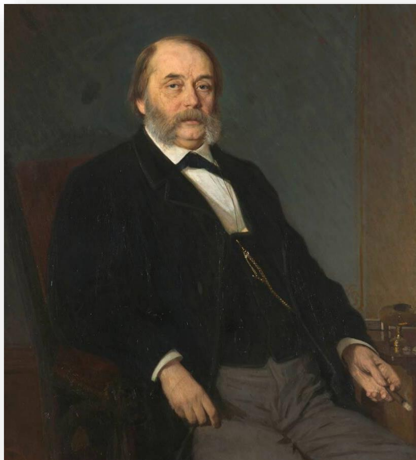
И.А. Гончаров (1812-1891)

«Литературе Вы принесли в дар целую библиотеку художественных произведений, для сцены создали свой особый мир. Вы один достроили здание, в основание которого положили краеугольные камни Фонвизин, Грибоедов, Гоголь»